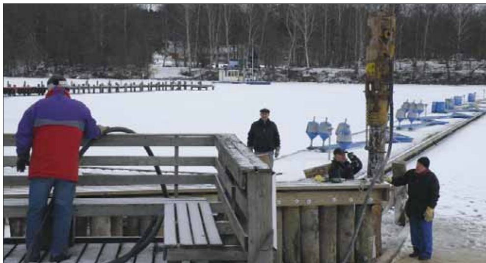
Stolparna trycks ner i det uppsågade hålet i isen