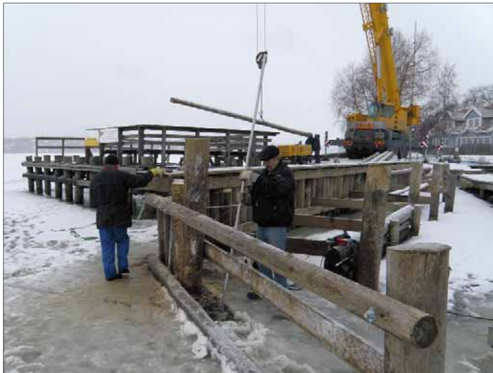
Stolpe på väg