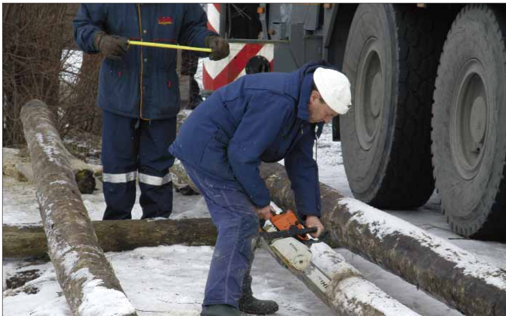
Stolparna spetsas före nedtryckning i vattnet