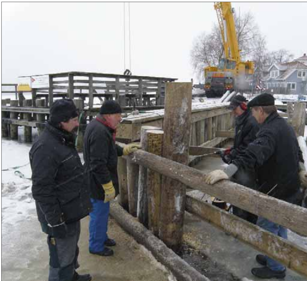
Den sista delen av vågbrytaren tar form Nu skall det vara tätt mellan land och den vågbrytande poptonen.