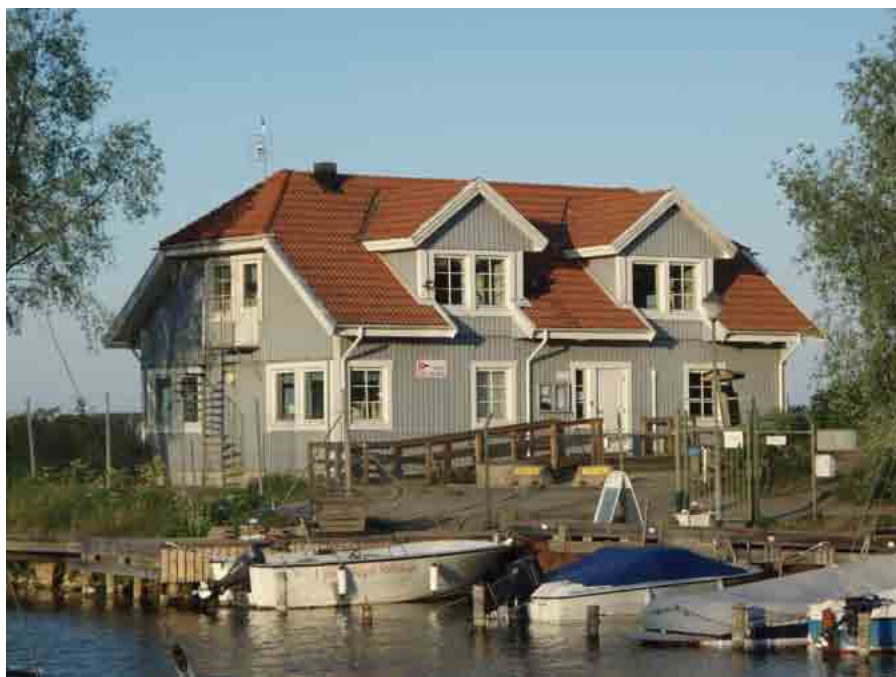
USS Klubbhus, uppfört 1989