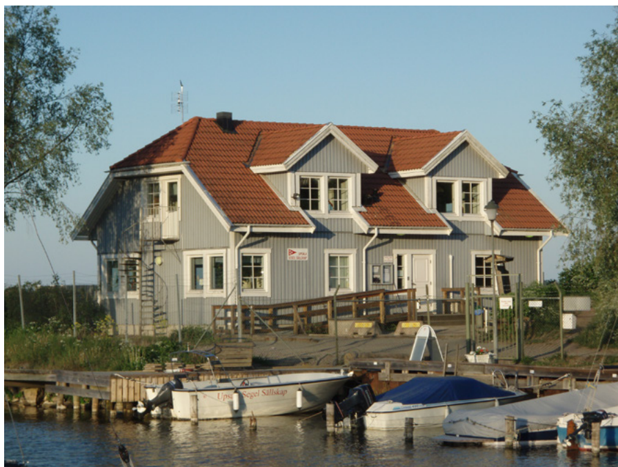
USS Klubbhus, uppfört 1989