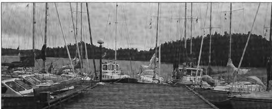
Bryggan vid Rosersberg