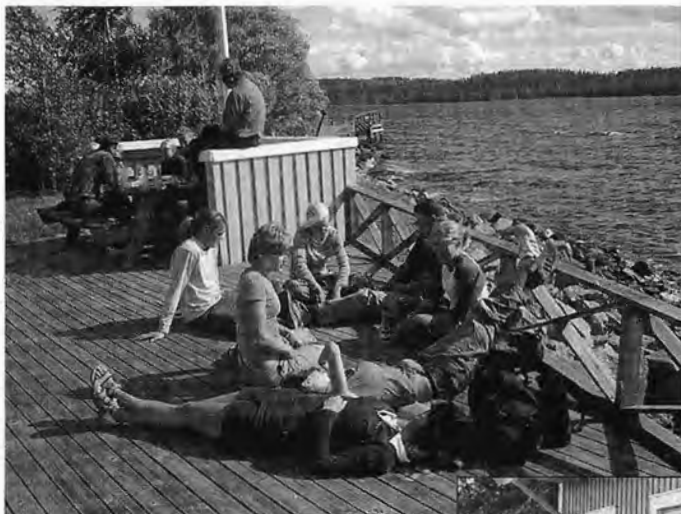
I väntan på priwsutdelning