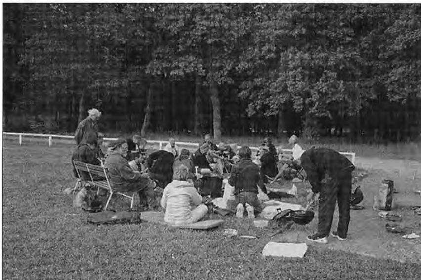
Grillning på kvällen.