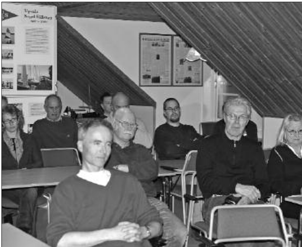
Publiken lyssnar hängivet till Nisses historier.

Under KOMMANDE SOMRAR SEGLADE Nisse och Kajjan kors och tvärs utefter Sveriges kuster och de knöt många kontakter under dessa år både till havs och i land på dansbanorna.