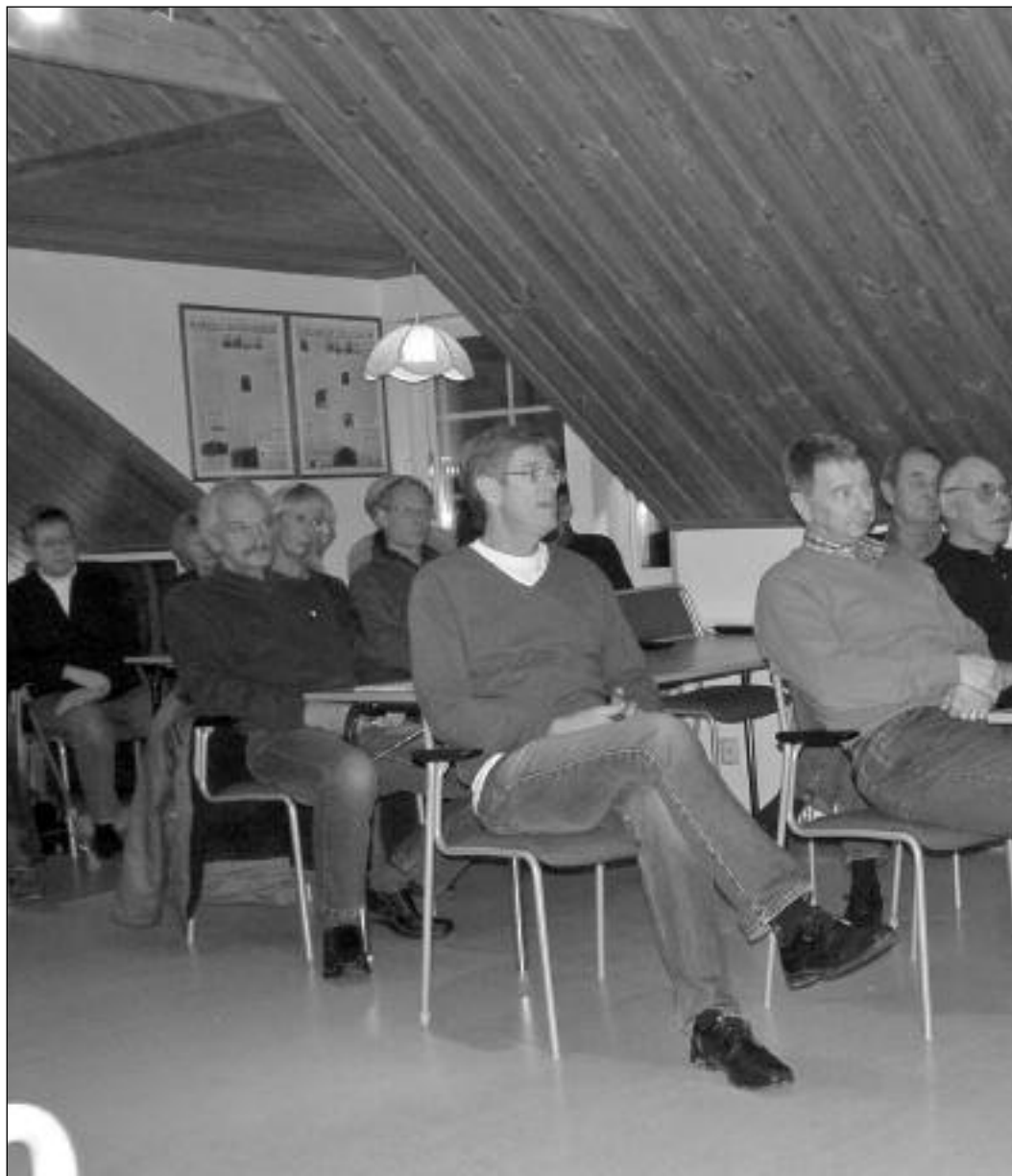
Båtliv framför fotboll