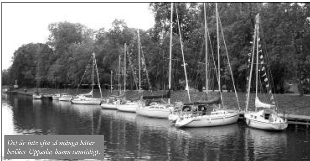
Det är inte ofta så många båtar besöker Uppsalas hamn samtidigt.