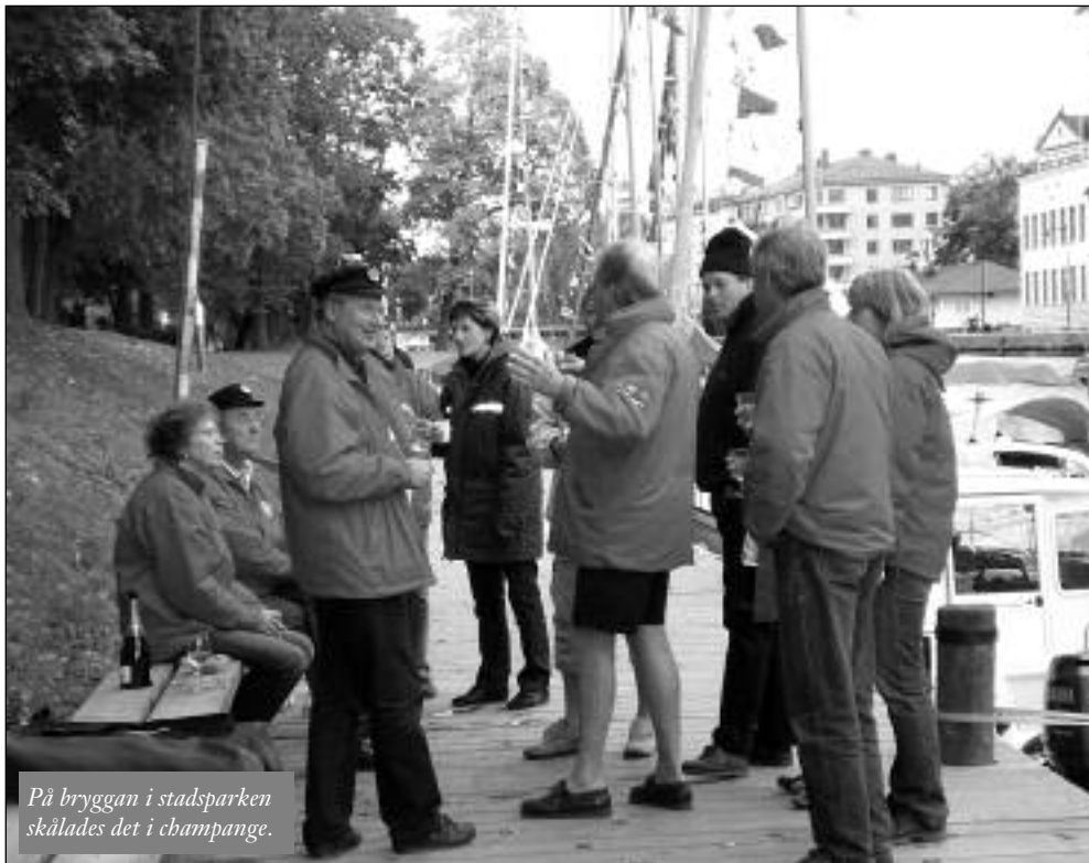
På bryggan i stadsparken skålades det i champagne.

Kvällen avslutades med kaffe, kaka och punsch. Alla var mycket nöjda med den lyckade dagen