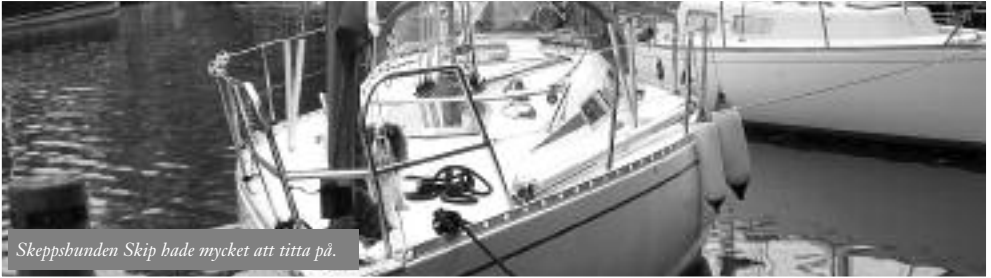
Skeppsbunden Skip bade mycket att titta på.